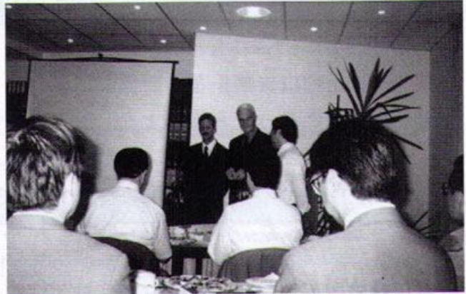
リップ税理士連盟訪問

所長「税理士のためになるそういう政党を捜しているが、いまだにない、というのが回答だ。そういう政治活動ではなく、税理士法改正等税理士にとって重要な立法に関していろいろ働きかけているようだ」